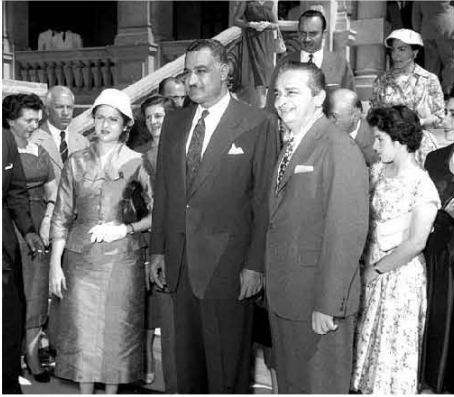
استقبال وفد برلماني برازيلي ١٩٥٧/١٠/٢